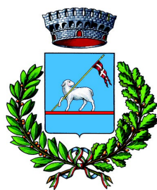
Comune di Canicattini Bagni