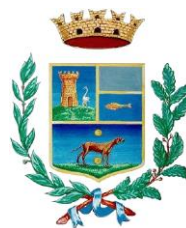
Comune di Carini